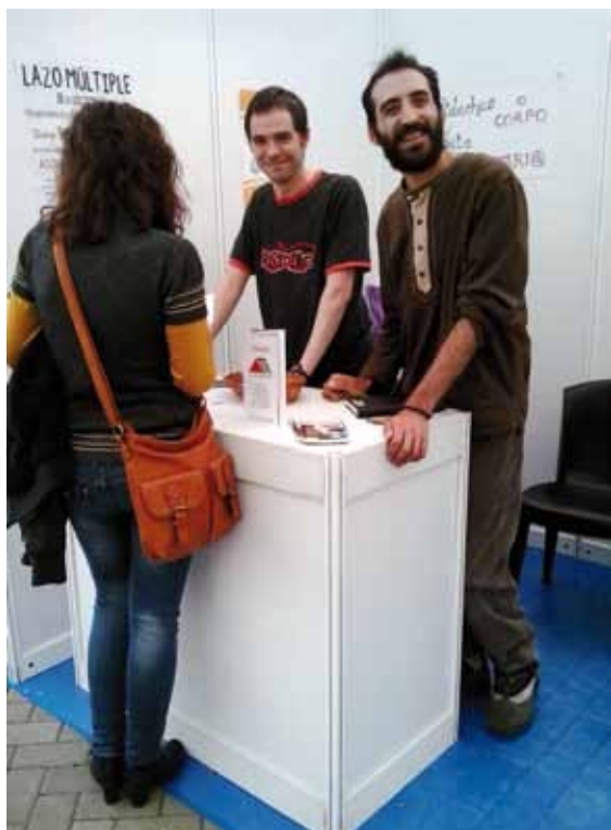
Voluntarios de AODEM en la Feira da Saúde.