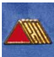
PIN Precio: 1 €