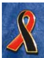
LAZO Precio: 2 €