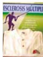
POLO BLANCO Precio: 18 €