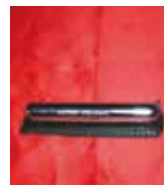
MECHERO CON FUNDA Precio: 6 €