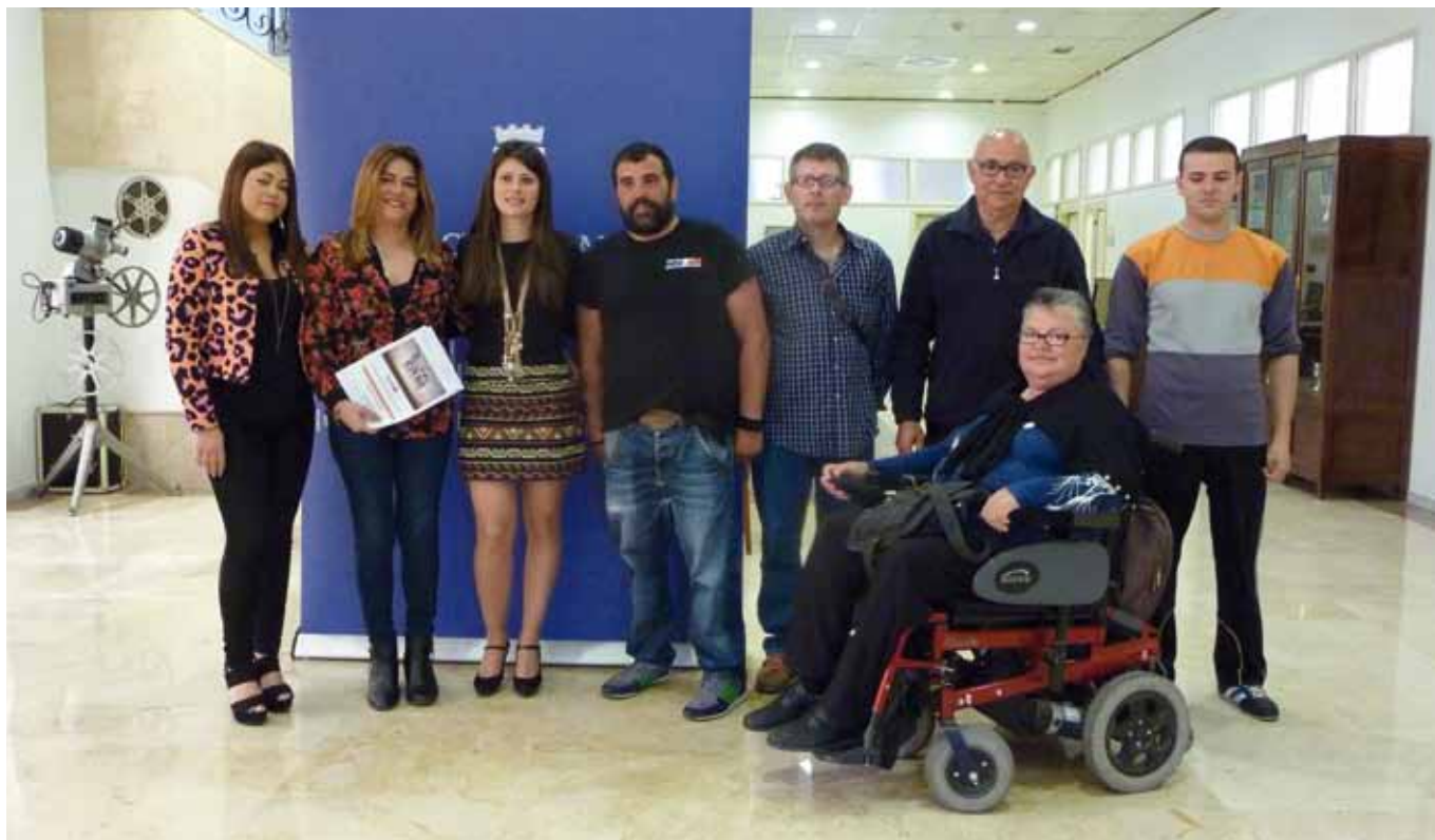
Foto de familia del deportista junto a la Diputada de Deportes, la Presidenta de AEMA y miembros de la asociación.