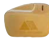
ENCENDEDOR Precio: 6 €