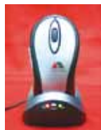
RATÓN INALÁMBRICO Precio: 35 €