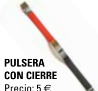
PULSERA CON CIERRE Precio: 5 €