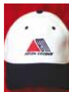
GORRA Precio: 6 €