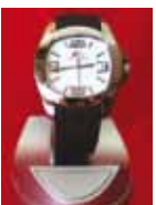
RELOJ DE CABALLERO Precio: 25 €