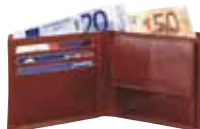
CARTERA Precio: 25 €