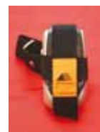
MUÑEQUERA PARA MÓVIL Precio: 6 €