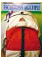
MOCHILA Precio: 20 €