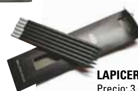
LAPICEROS Precio: 3 €