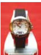
RELOJ DE SEÑORA Precio: 25 €