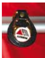
LLAVERO Precio: 4 €